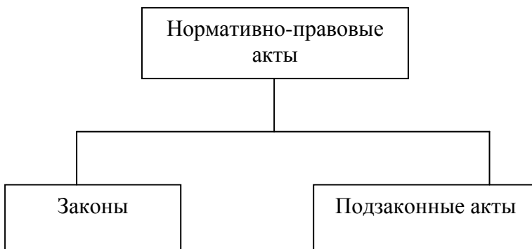
Рисунок 2 – Виды нормативно-правовых актов 1

Если рисунок является авторской разработкой, необходимо после заголовка рисунка поставить знак сноски и указать в форме подстрочной сноски внизу страницы, на основании каких источников он составлен, например: